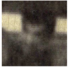
Fotografía del Teatro del Odéon de París y uno de los retratos extractados por Daniel Silvo, que componen su instalación Europa crítica (abajo).