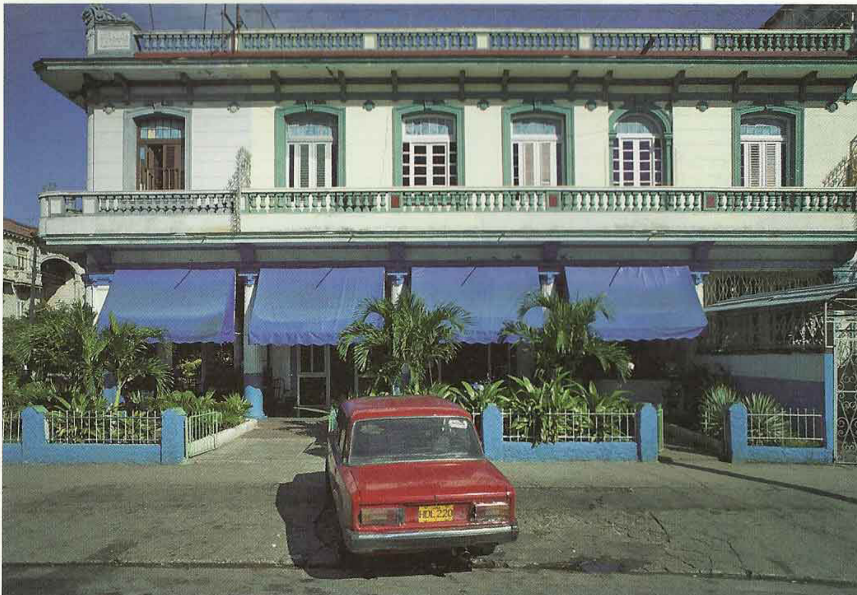
Lada rojo , 2010.